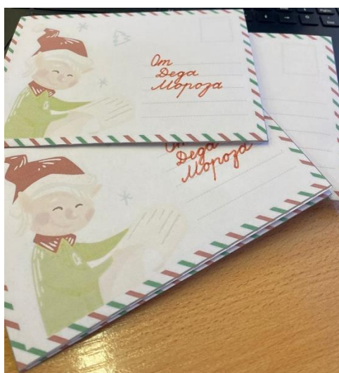
Новогоднее настроение своими руками