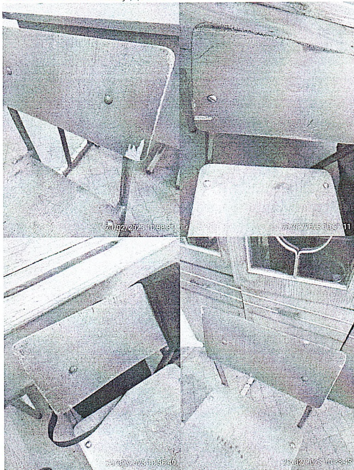
Фото №№ 1- 4 - В учебных кабинетах №№ 2, 3, 15- используются учебные стулья с дефектами покрытия- имеются сколы и трещины, что не позволяет проводить качественно их обработку моющими и дезинфицирующими средствами.

Фототаблица № 1 к акту профилактического визита МБОУ «Средняя общеобразовательная школа № 19» по адресу: Алтайский край, г. Бийск, ул. Севастопольская, дом 39.